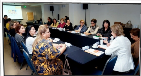
Reuniões preparatórias para as eleições de 2018