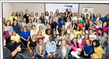
Cursos de capacitação para pré-candidatas