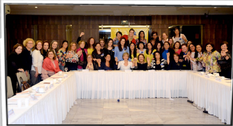
Reuniões da Coordenação Executiva do Secretariado Nacional da Mulher